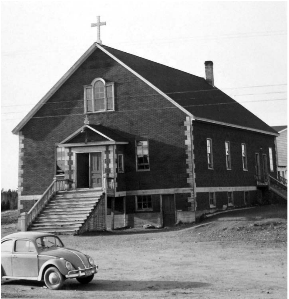
ancienne salle paroissial

(2) Le Père Vital est décédé à l'hôpital de Moncton le 20 avril 1920. Il était depuis novembre 1918 vicaire à St-Anselme.