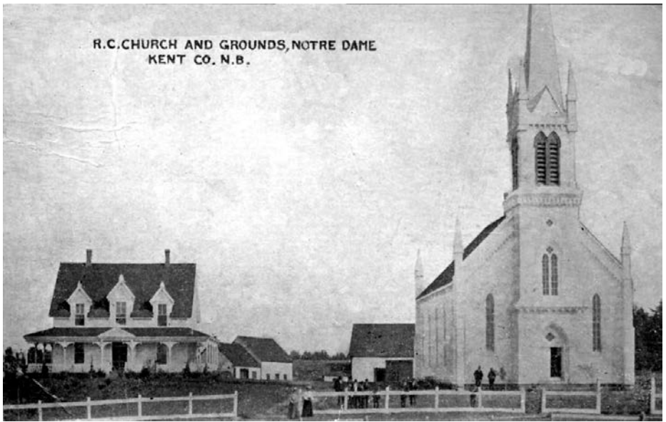
ancienne église et presbytère