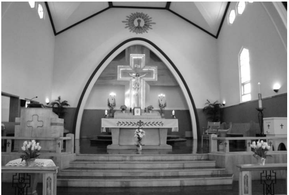
intérieur de l'église