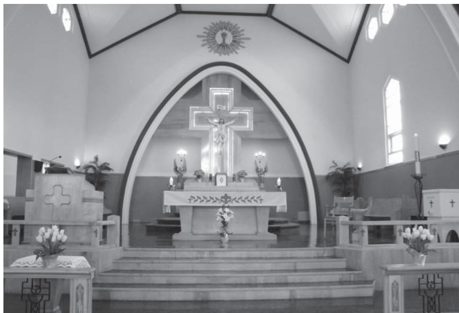
intérieur de l'église