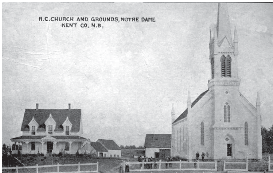
ancienne église et presbytère (vers 1901)