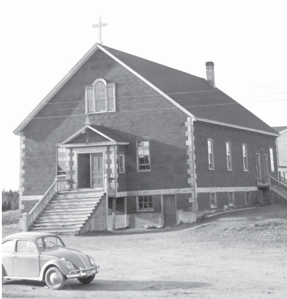
ancienne salle paroissiale

(2) Le Père Vital est décédé à l'hôpital de Moncton le 20 avril 1920. Il était depuis novembre 1918 vicaire à St-Anselme.