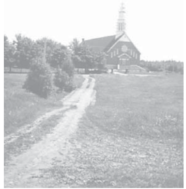
Église Notre-Dame-du-Sacré-Cœur (vers 1951)